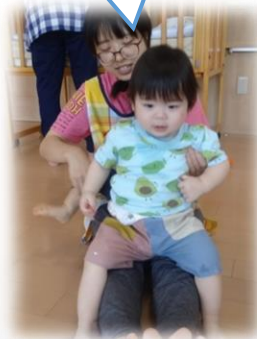
保育者・お友だちとの関わり♪